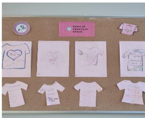
NAŠE RUŽIČASTE MAJICE NOSE PORUKU KAKO REAGIRATI NA NASILJE I POMOĆI ŽRTVI

Hrvatski je sabor 2017. godine izglasao obilježavanje Nacionalnog dana borbe protiv vršnjačkog nasilja poznatijeg kao "Dan ružičastih majica". Dogovoreno je da se taj dan obilježava svake zadne srijede u večljači. S obzirom da su ove godine u to vrijeme praznici u našoj školi obilježili smo srijedu prije - 15.2. Održane su radionice na satu razrednika, a na Vijeću roditelja održano je predavanje za roditelje.