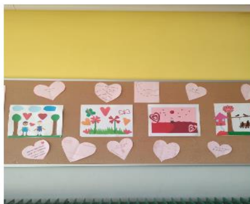
RUŽIČASTO SRCE NENASILJA SPOJILO SE SA CRVENIM SRCEM VALENTINOVA