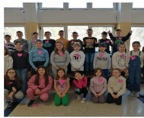
KAD NEMAMO RUŽIČASTE MAJICE IMAMO RUŽIČASTO SRCE ZA NENASILJE